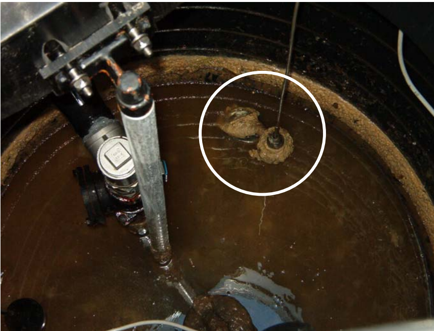
Kuva rasvoittuneesta puhdistettavasta pintakytkimestä.

❗ MUISTA KATKAISTA SÄHKÖNSYÖTTÖ PÄÄKYTKIMESTÄ ENNEN PUMPUN NOSTAMISTA.